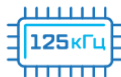
Карта формата EM-Marin