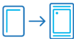
Считывание карты до 10 см

Proximity-карта формата EM-Marin. Рабочая частота — 125 кГц. Расстояние считывания — до 10 см. Материал — пластик. Диапазон рабочих температур — от -10 до +50°C. Габаритные размеры — 86x54x0,8 мм.