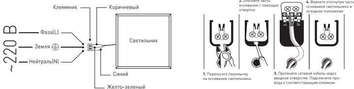
Рис.1. Схема подключения светильника SPO-6-36...-А (с клеммником для БАУ).

3.3.1. Для подключения светильника необходимо подвести к месту его монтажа 3-х жильный провод. 3.3.2. Этот провод необходимо подключить к проводу источника питания с помощью клеммника (в комплект не входит) в соответствии со схемой, изображенной на рис. 1; модель SPO-6-36 не имеет вывода проводов, подключение происходит через клеммную колодку в соответствии со схемой на рис. 2.