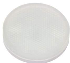
PLED GX53 8w