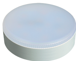
PLED GX53 12w