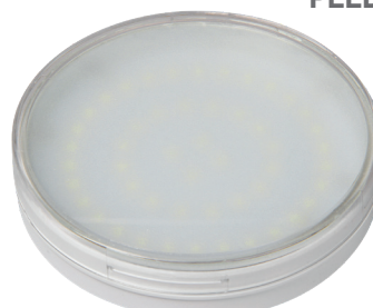
PLED GX70 11w