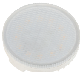
PLED GX53 10w