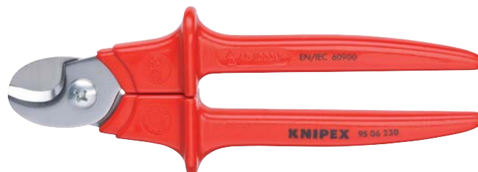
95 06 230 ⚡ 1000V ⚠ ⚡ ⚡