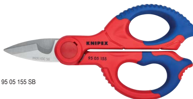
95 05 155 SB