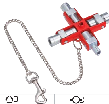
00 11 06