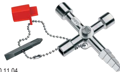
00 11 04