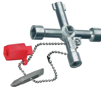
00 11 03