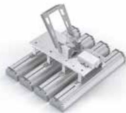
V4-10-70.0002.IRO-0003 Поворотное крепление для 4 шт. светильников 450×276×300mm