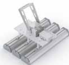
V4-10-70.0002.IRO-0002 Поворотное крепление для 3 шт. светильников 325×276×300mm