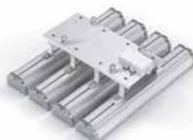
V4-10-70.0003.IRO-0003 Подвесное крепление для 4 шт. светильников 450×120×300mm