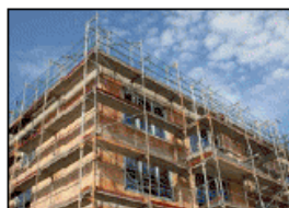
Монтаж строительных лесов