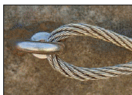
Монтаж такелажных систем