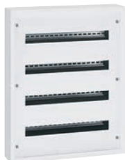
3 372 04

распределительные шкафы в металлическом корпусе, готовые к эксплуатации