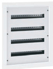
3 372 24